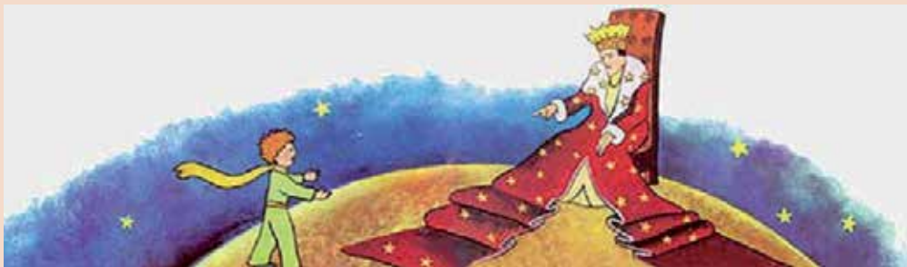
El principito , Antoine de Saint Exupéry