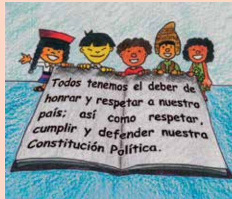
Constitución peruana para niños

Nos los representantes del pueblo de la Nación Argentina, reunidos en Congreso General Constituyente por voluntad y elección de las provincias que la componen, en cumplimiento de pactos preexistentes, con el objeto de constituir la unión nacional, afianzar la justicia, consolidar la paz interior, proveer a la defensa común, promover el bienestar general, y asegurar los beneficios de la libertad, para nosotros, para nuestra posteridad, y para todos los hombres del mundo que quieran habitar en el suelo argentino: invocando la protección de Dios, fuente de toda razón y justicia: ordenamos, decretamos y establecemos esta Constitución, para la Nación Argentina.