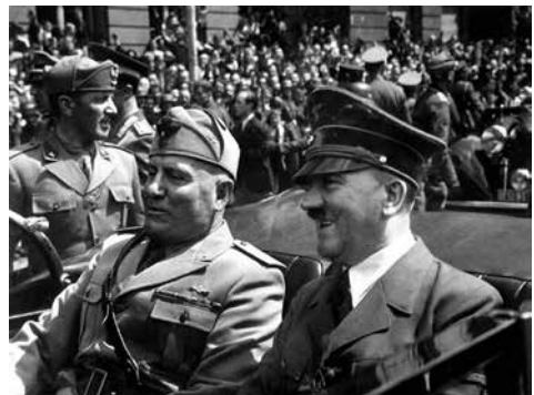
Hitler y Mussolini (junio 1940) lideraron Estados totalitarios

El régimen político es la dirección ideológica que adopta una forma política, de acuerdo a los objetivos finales y a las convicciones y creencias del grupo gobernante. Los gobiernos, a través de sus instituciones, materializan en normas jurídicas (reglas de conducta obligatorias) el contenido ideológico del grupo social dominante.