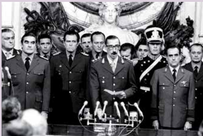
Dictadura militar en Argentina