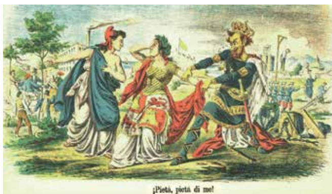
Alegoría de España indecisa entre la Monarquía y la República. Revista La Flaca , 15 de mayo de 1865