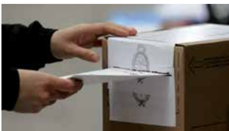
Democracia indirecta: elecciones de representantes

En todo sistema político basado en la soberanía popular, cuando el pueblo no gobierna directamente, lo hace a través de representantes. Estamos hablando, entonces, de democracia indirecta o representativa . Nuestra Constitución tomó esta forma de gobierno y lo expresa en su artículo 1º: “La Nación Argentina adopta para su gobierno la forma representativa...”. Además, en el artículo 22 sostiene: “El pueblo no delibera ni gobierna sino por medio de sus representantes y autoridades creadas por esta Constitución. Toda fuerza armada o reunión que se atribuya los derechos del pueblo y peticione a nombre de este, comete delito de sedición”.