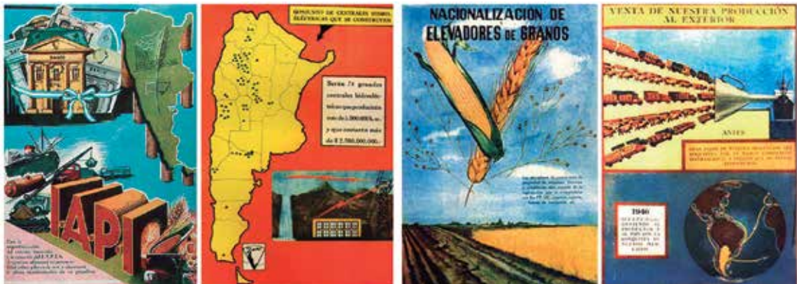
Estado de bienestar bajo el peronismo

Conjunto de ideas políticas y económicas que sostiene la no participación del Estado en la economía, y fomenta la producción privada sin subsidio del gobierno. Entre sus características están la poca intervención del gobierno en el mercado laboral; privatización de empresas estatales; libre circulación de capitales internacionales; medidas contra el proteccionismo económico; oposición al exceso de impuestos, etcétera.