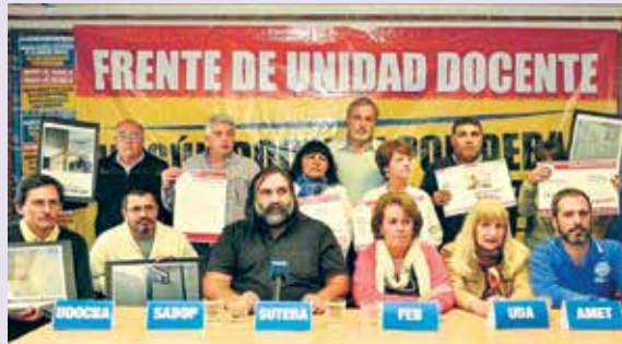
Los docentes bonaerenses rechazaron dar clases en las vacaciones