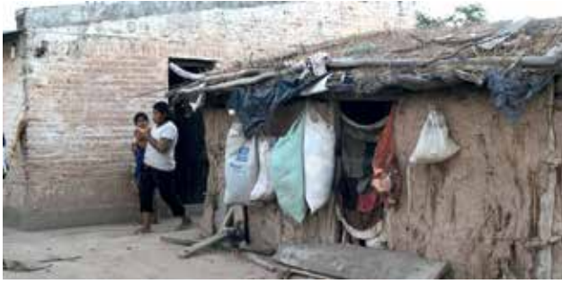
Pobreza extrema en las comunidades indígenas de Argentina

Por lo que se ve en la historia de los reclamos, en algunas oportunidades estos han tenido éxito y en muchas otras no. La destrucción de sus territorios incrementó las migraciones, por lo que existe muchísima gente de pueblos originarios habitando en los suburbios de las grandes ciu-