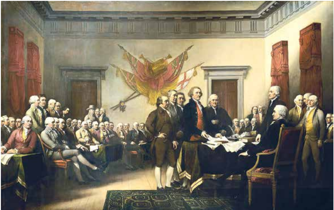
El 4 de julio de 1776, el Segundo Congreso Continental anuncia que Norteamérica era libre y que las 13 colonias ahora eran los nuevos Estados Unidos de América independientes

Sin embargo, la conquista de un derecho político, social, económico o cultural, no asegura que luego no se retroceda en este logro y el derecho desaparezca o se deteriore. Durante la Revolución Francesa se había redactado la Declaración de los Derechos del Hombre y del Ciudadano (1789), donde se proclamaba el lema “Libertad, Igualdad, Fraternidad”. Con la ella nace el concepto de ciudadanía universal que trae como principio que todos los ciudadanos son iguales ante la ley, con libertad de pensamiento, libertad de palabra, de reunión, de culto, pero también tienen la obligación de pagar impuestos, y de ir a la guerra. Sin embargo, cuando una mayoría de burgueses moderados estableció en 1791 la Constitución francesa, en ella no se otorgaba el sufragio universal, sino que era censitario : el derecho a ser votado estaba limitado a los más pudientes; los ciudadanos se clasificaban en activos –que tenían derecho a elegir, a participar en asambleas, formar parte de la Guardia Nacional en defensa de la patria, y, según sus bienes, a ser elegidos– y pasivos , que prácticamente estaban desposeídos de derechos políticos.