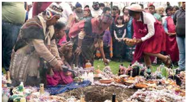
Ceremonia de la Pachamama