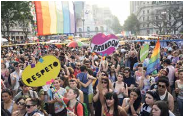
Manifestación a favor de la ley de matrimonio igualitario

Las fuerzas que se hacen presentes con sus preocupaciones en los debates previos a los que se dan en las cámaras, no responden en general a líderes políticos ni a personas individuales, sino que se relacionan con grupos de interés o colectivos que tienen determinada fe religiosa, factores de tradición, réditos económicos por actividad, necesidades sindicales, cuestiones de género, visiones políticas o ideológicas, etcétera.