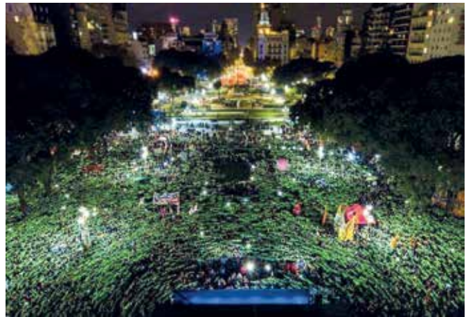
Gente manifestándose a favor del proyecto de Ley de Interrupción Voluntaria del Embarazo