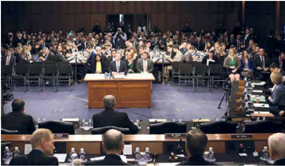
Mark Zuckerberg, CEO de Facebook, compareció ante un comité de senadores estadounidenses por el escándalo de Cambridge Analytics, la consultora que usó indebidamente información de 87 millones de usuarios de Facebook

países ya hablan de la contaminación de las libertades en las sociedades altamente tecnificadas. El tema plantea cuestionamientos éticos y políticos. Se han establecido en todo el mundo empresas que recaban datos de toda índole, entre ellos los referidos a las personas, para almacenarlos y distribuirlos, comercializándolos. Esta actividad, en principio, es lícita o permitida ya que se encuentra protegida por el derecho a trabajar, ejercer industria lícita y comerciar. Pero resulta que las personas allí registradas generalmente no fueron consultadas y sus datos son manipulados por inescrupulosos, afectando su intimidad o coartando otros derechos con consecuencias negativas. Por ejemplo, no corresponde que en bancos de datos haya información relativa a la afiliación o adhesión política, culto religioso, participación o afiliación sindical, gustos personales, preferencia de género, etcétera.