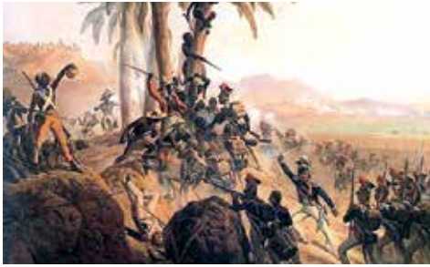
Una revuelta de esclavos en Haití inicia la liberación latinoamericana

A lo largo de la historia de la humanidad, los seres humanos que tenían menos derechos o que no tenían derechos reconocidos por la sociedad en la que vivían, lucharon por mejorar su condición, o en contra de las medidas o acciones que consideraban injustas. Muchas veces fueron reprimidos violentamente, como sucedió con la rebelión de esclavos liderada por Espartaco en la República Romana (73-71 a. C.), que venció varias veces a los ejércitos romanos, pero luego fue aniquilada y 6000 esclavos murieron crucificados. Sin embargo, otras veces, tras sufrir masacres, lograron la victoria,