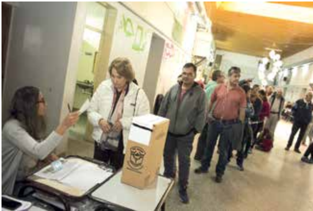
A partir de 2011, el padrón electoral se organiza por orden alfabético, por lo que mujeres y hombres comparten la mesa electoral donde les toca votar

Sin embargo, pese al voto de las mujeres, su representación en el Congreso era muy minoritaria. Debido a esto, en 1991 se dictó la Ley 24.012 “Ley de Cupo Femenino”, que estableció un mínimo del 30 por ciento de candidatas mujeres en las listas; para que fueran ubicadas en puestos con posibilidades de resultar electas, se determinó (en 1993) que cada dos varones debía ir como mínimo una mujer. Actualmente, cumpliendo el artículo 37 de la Constitución, la Ley 27.412 sostiene que debe haber paridad de género en las elecciones legislativas, ubicando en la lista de candidatos de manera intercala-