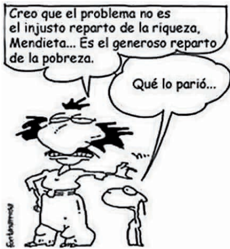
Desigualdad. Fuente: Fontanarrosa

económicos. Los países dependientes, con economías subdesarrolladas, difícilmente pueden garantizar los derechos humanos básicos para todos sus habitantes. Acuciados y condicionados por la deuda externa, se ven impedidos de ejercer el derecho a su autodeterminación, que es uno de los derechos de los pueblos, junto con el derecho a la estabilidad y a la paz.