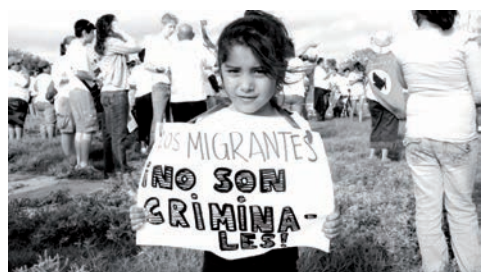
Lucha por la dignidad

Toda persona tiene derecho a ser respetada como ser humano y valorada como tal. En eso consiste la dignidad: no ser considerado menos, no ser visto ni tratado como inferior. Entonces, el derecho a la dignidad humana se fundamenta en apreciar al ser humano sin importar las diferencias, brindando las posibilidades de vivir en condiciones que le permitan desarrollarse en su plenitud.